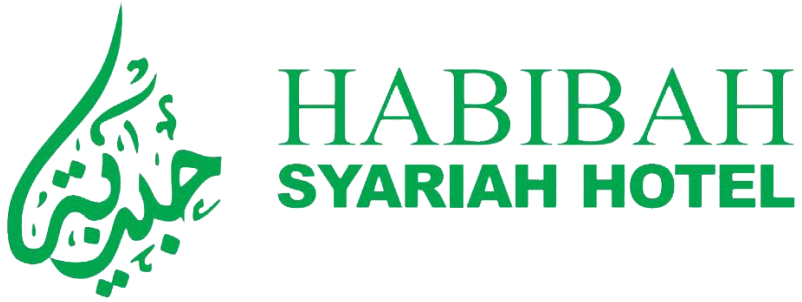
Gambar 3.1 Logo Habibah Syariah Hotel