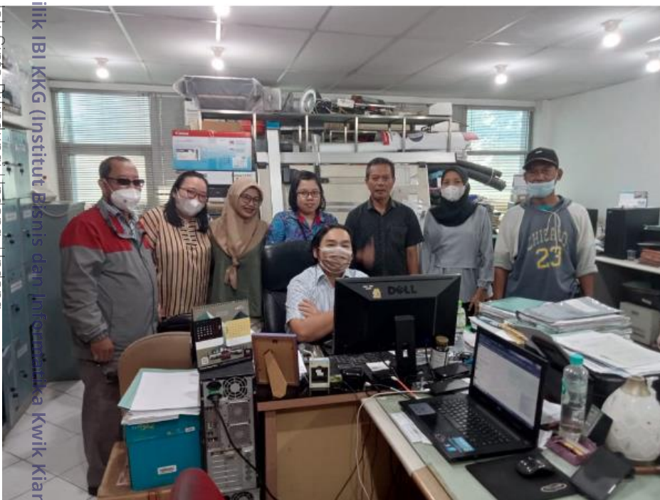
Foto Anggota Perusahaan

Hak cipta milik IBI KKG (Institut Bisnis dan Informatika Kwik Kian Gie)