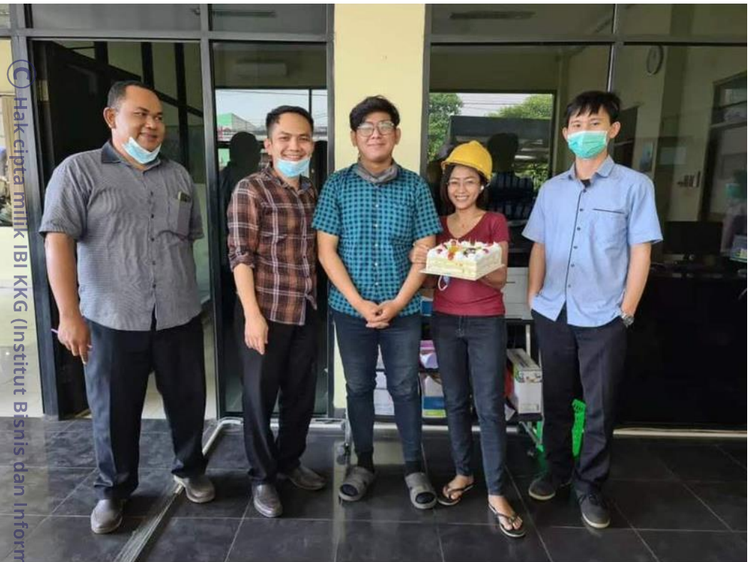
C Hak cipta milik IBI KKG (Institut Bisnis dan Informatika Kwik Kian Gie)