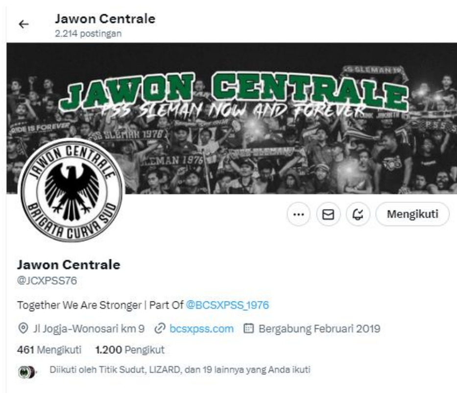
Gambar 1.1 Akun X Jawon Centrale

Salah satu sub kelompok yang ada di dalamnya adalah Jawon Centrale . Demikian halnya dengan Jawon Centrale merupakan salah satu komunitas supporter tim sepakbola PSS Sleman yang berada di Jalan Jogja-Wonosari Kilometer 9 tepatnya di daerah Berbah, Sleman, Daerah Istimewa Yogyakarta. Komunitas supporter ini memiliki akun X yang digunakan untuk dalam mendukung klub PSS Sleman.