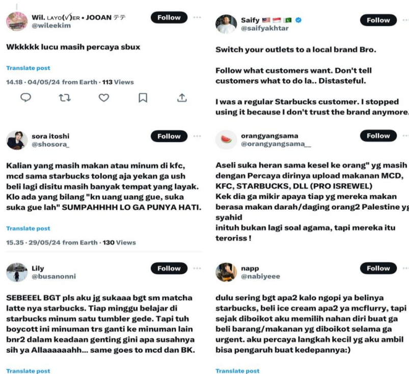
Gambar 1. 4 Unggahan X Mengenai Kegiatan Boikot Starbucks

Peneliti melihat bahwa citra merek dan kepercayaan merek yang selama ini telah dibangun oleh Starbucks selama ini berpotensi untuk mengalami penurunan akibat dari fenomena DBS Movement . Hal tersebut juga berdampak kepada tingkat loyalitas konsumennya. Bahkan dalam konteks loyalitas merek, beberapa dari konsumen Starbucks telah menemukan alternatif merek lain untuk menggantikan Starbucks sebagai merek kedai kopi favorit mereka. Hal ini tidak hanya berlaku untuk Starbucks, tetapi juga untuk merek-merek di Indonesia yang dikaitkan dengan Amerika atau Israel. Perusahaan-perusahaan tersebut, termasuk Starbucks yang sudah berdiri selama 53 tahun, mungkin mengalami