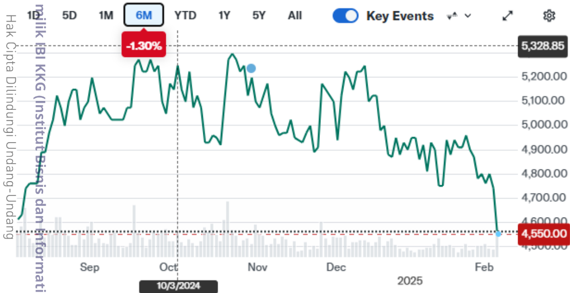
Lampiran gambar grafik tidak memenuhi 4.29