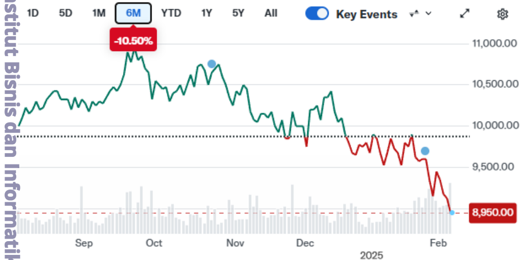
Lampiran gambar grafik tidak memenuhi 4.29

Hak Cipta milik IBI KKG (Institut Bisnis dan Informatika Kwik Kian Gie)