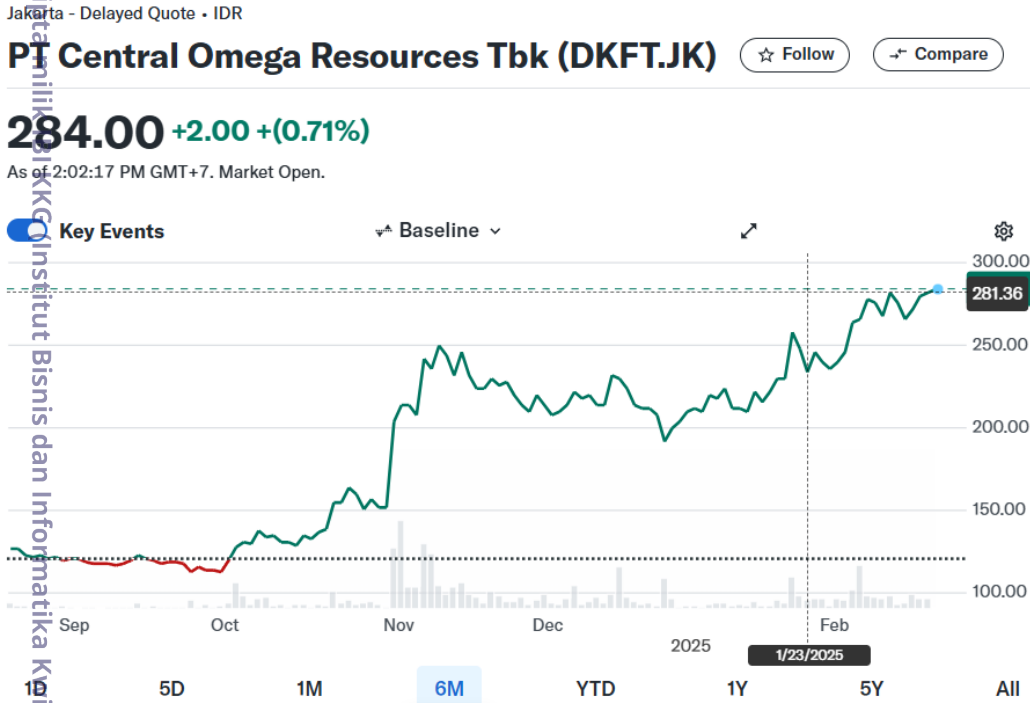
Lampiran gambar grafik memenuhi 4.29