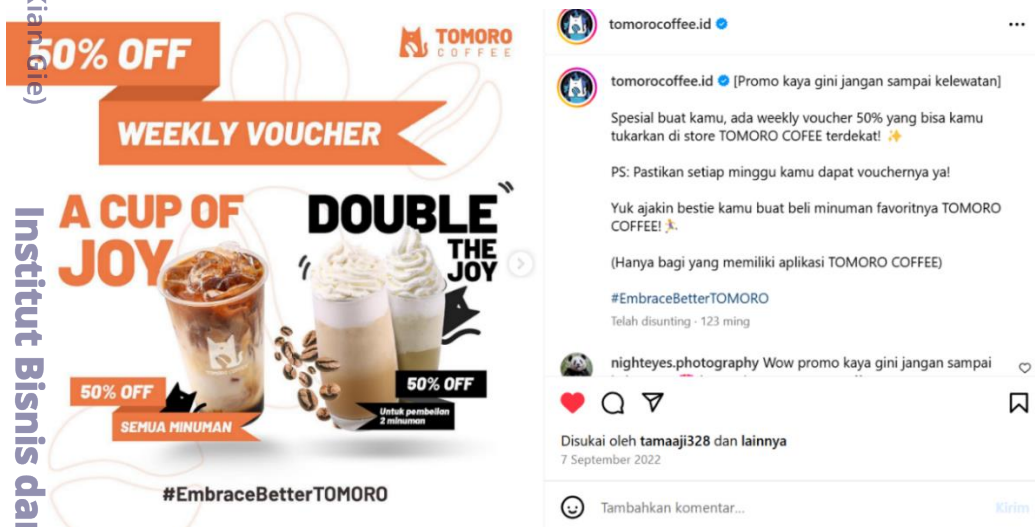
Gambar 3.1 Konten Akun Instagram TOMORO COFFEE tahun 2022