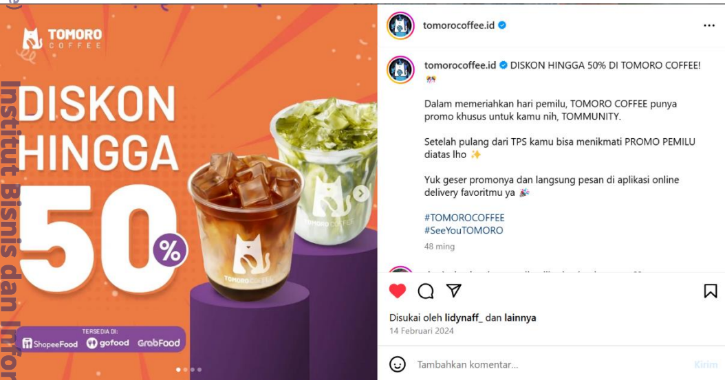
Gambar 3.3 Konten Akun Instagram TOMORO COFFEE tahun 2024

© Hak cipta milik IBIKKG (Institut Bisnis dan Informatika Kwik Kian Gie)