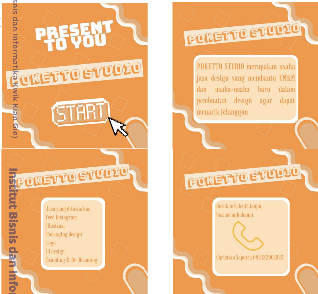
Gambar 5. 2 Promosi dari POKETTO STUDIO

Promosi yang dilakukan oleh POKETTO STUDIO ada dari instagram dan juga melalui platform lain seperti behance dan dribbble, bentuk promosi yang ditawarkan adalah dengan menghadirkan jasa-jasa yang kami tawarkan, serta hasil dari jasa yang ada di POKETTO STUDIO. Berikut adalah contoh promosi yang akan dilakukan oleh POKETTO STUDIO.