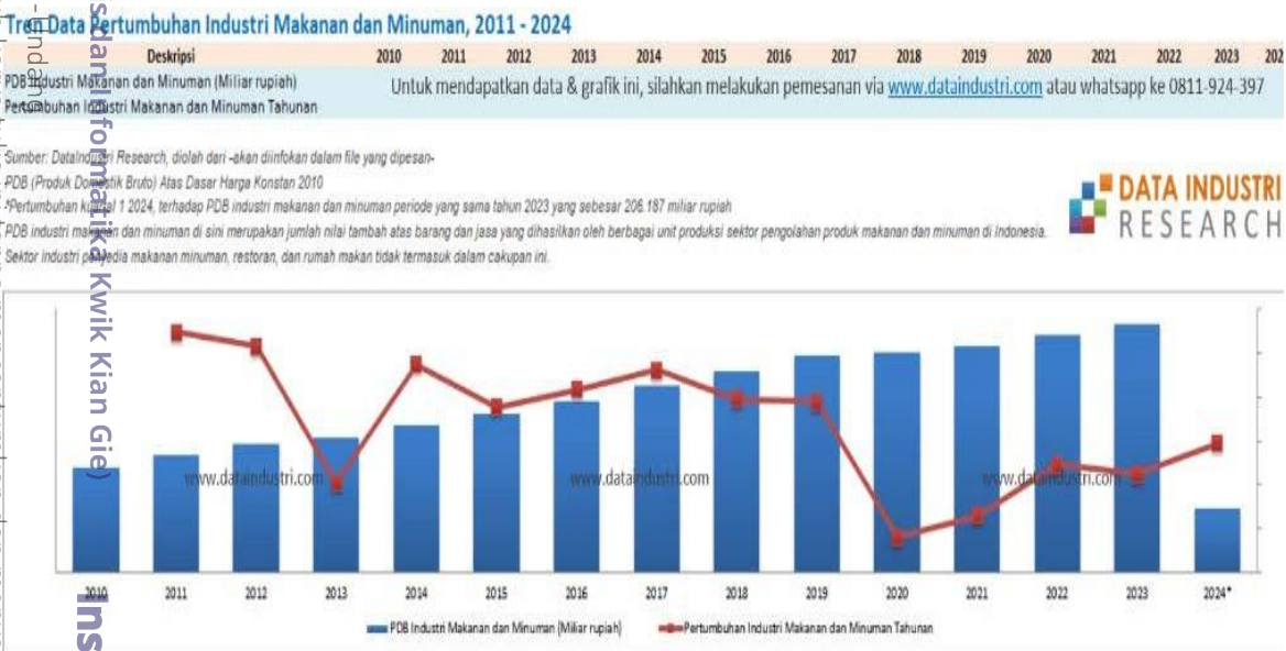
Gambar 3.1 Tren Data Pertumbuhan Industri Makanan dan Minuman Tahun 2011-2024

Sumber: https://www.dataindustri.com/produk/data-pertumbuhan-industri-makanan-dan-minuman/